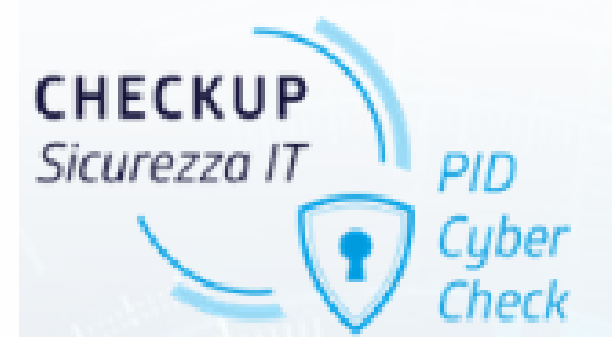
PID CYBER CHECK