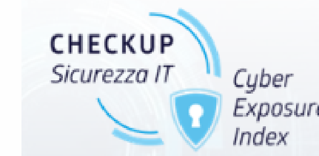
CYBER EXPOSURE INDEX

Strumenti di valutazione del livello digitale e di sicurezza informatica