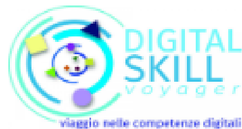
DIGITAL SKILL VOYAGER