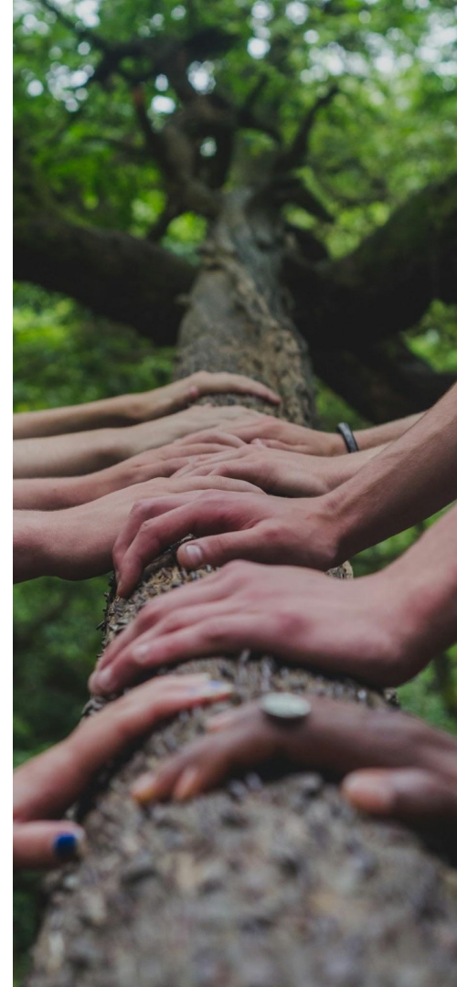
Illustrazione di come una comunicazione trasparente possa aumentare la fiducia degli istituti bancari.

Discussione sull'importanza della trasparenza e della divulgazione delle informazioni ESG.