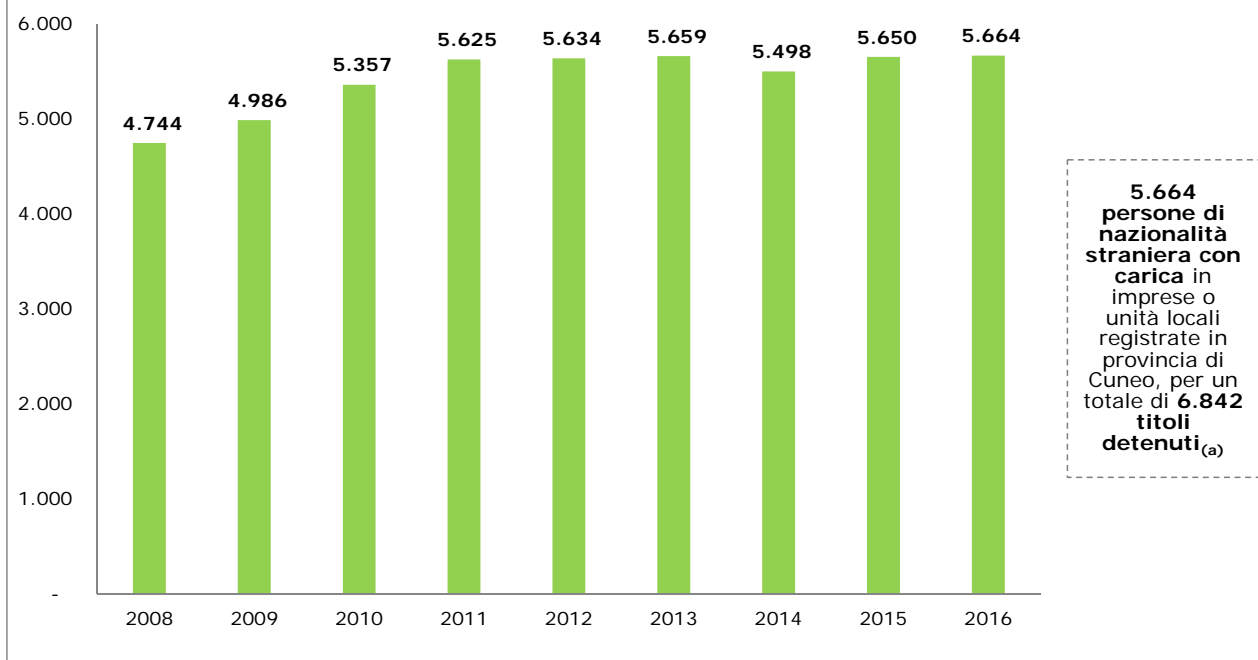
Graf. 5.12 - Imprenditori di nazionalità straniera in provincia di Cuneo. Anni 2008-2016

(a) Numero di titoli complessivamente posseduti dalle persone (fisiche o giuridiche), ciascuna delle quali può essere titolare di più cariche/qualifiche, nelle diverse tipologie di imprese.